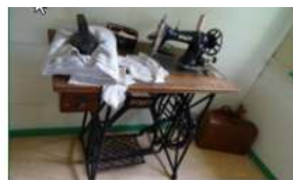
Ein Piepke stikzie