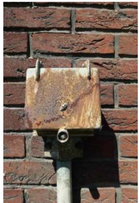
't Raodselechtig iezere kesje, wie oppe ziekantj van 't stadhoes zoot en wo de antennes van de wages mit verbónje wore.