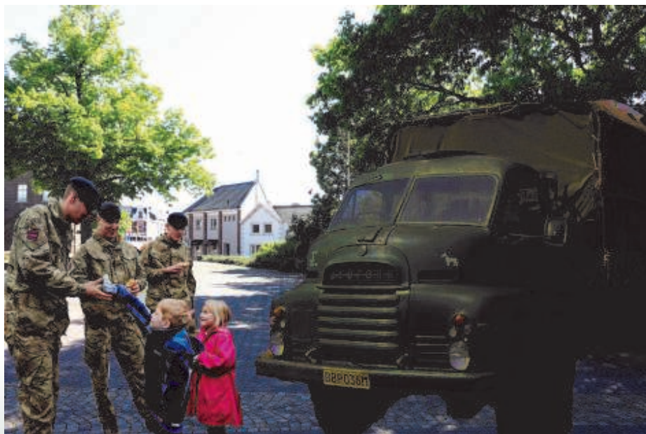
Ein fotocompilaasj óm eine indrök te gaeve. 't Kirkplein is hiej uiteraard anges es in de 60er jaore..

Op einen daag stóng ter heugte van wo noe 't oorlogsmonument is oppe kirkberg, eine groate Ingelse seldaotewage. Camouflagenette loge d'r euver haer en wore es ein saort luifel gespanne toet oppe gróndj. Dao ónger zote 'n paar seldaote die vruntjelijk noa ós lachdje. Noa sjoal flot op dae wage aan. Inne sjoal hawwe w'r weinig deug gedaon..... Ze hawwe net gegaete en vroege of emes van ós get sigarètte wól haole. Einen durfal vanne 6e klas booj zich aan, kreeg geldj mit en waerdje door ós vol bewonjering naogekeke! Wie daen held trök koom stoke de seldaote zich ein sigaret op en waerdje de grootste lummels ónger ós auch ein aangeboaje. Mit henj en veut koom toen get van ein gesprek op